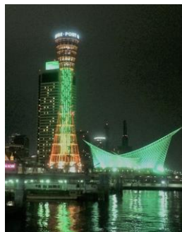
神戸ポートタワー

「ライトアップ in グリーン運動」の詳細は、日本緑内障学会 HP ( http://www.ryokunaisho.jp/ ) をご覧ください。